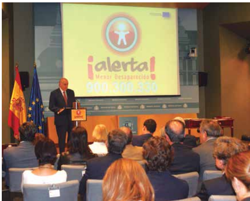
El Ministro del Interior, durante la presentación.

Cualquier medio de comunicación, organismo o entidad pública o privada con capacidad consolidada de transmisión de mensajes a la sociedad podrá adherirse al Sistema. ★