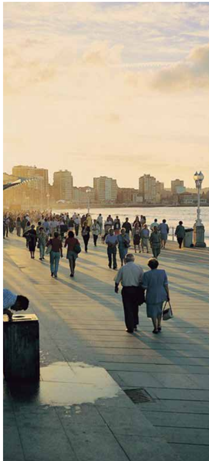
Gijón es uno de los nuevos municipios turísticos.