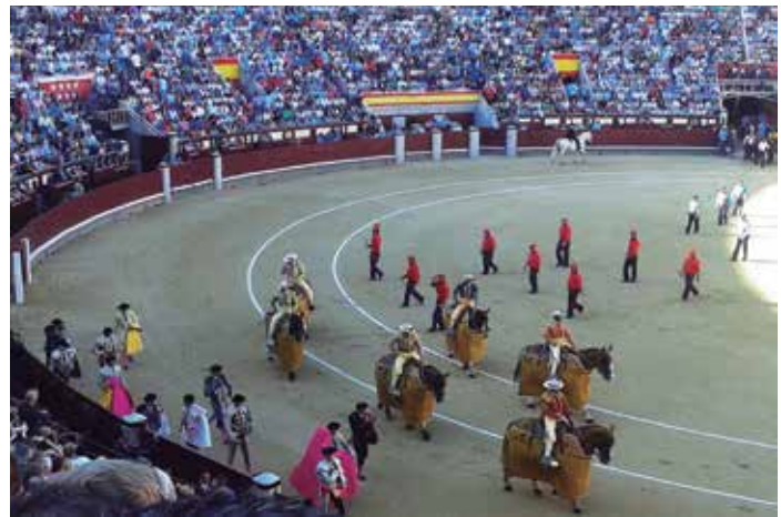
La Federación también participa en el Programa PENTAURO, para la regulación de la tauromaquia como patrimonio cultural.

El total de subvenciones previstas este año para los gastos de funcionamiento de los Juzgados de Paz es de 1.994.210 euros, cifra que representa un 8% menos de la consignada al mismo fin el pasado año. Desde el Ministerio de Justicia se propusieron tres posibilidades de distribución en función de la población de cada Ayuntamiento, y la FEMP ha optado por la que ofrece una reducción porcentual del importe de la subvención más homogénea para todos los tramos, ya que, además, contempla una menor diferencia entre los tramos que sufren más y menos reducción. ★