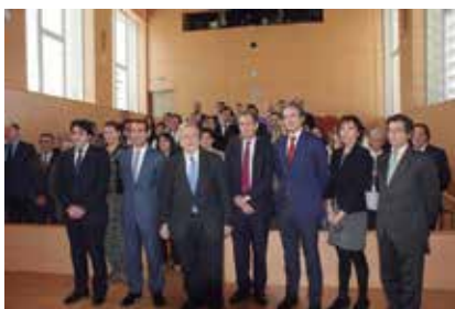
Acto de promoción de “Emprende en 3” en la Comunidad de Madrid.

Los ganadores de las seis categorías de este galardón se anunciarán en el mes de octubre.