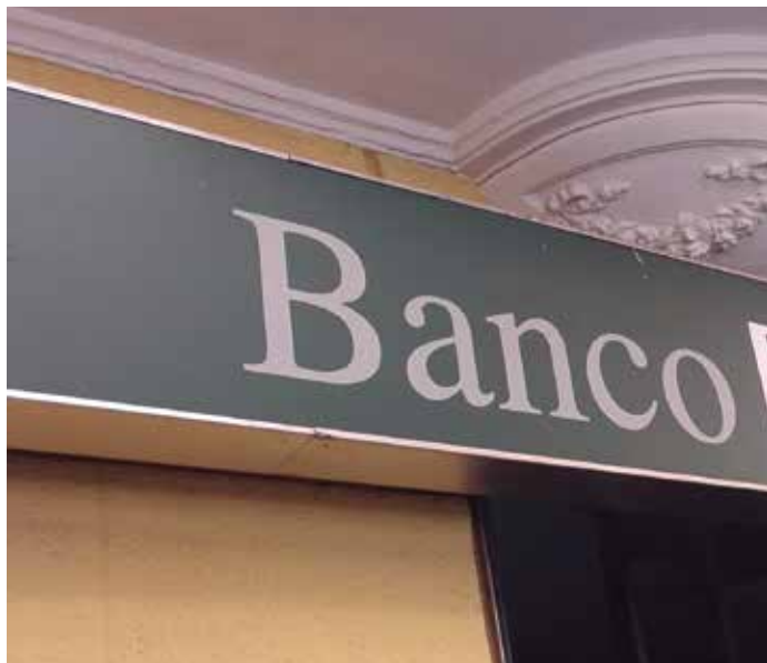
Las Entidades Locales podrán concertar nuevas operaciones de crédito en el mercado bancario

del interventor en el que se certifique el ahorro financiero anual que va a producirse como consecuencia de suscribir la nueva operación de endeudamiento.