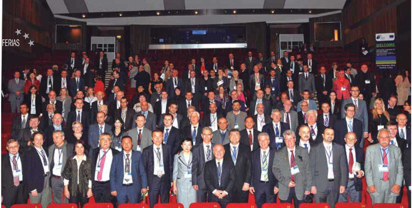
Integrantes del Pacto de Alcaldes, reunidos en Estambul, en noviembre de 2013.