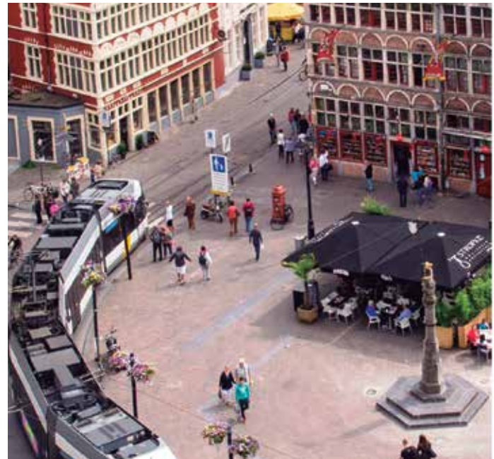
El pasado año participaron 1.931 ciudades europeas.

La semana culminará con el día dedicado a "La ciudad sin mi coche", en el que las ciudades y pueblos habilitan zonas exclusivas para peatones, ciclistas y transporte público, durante todo el día.