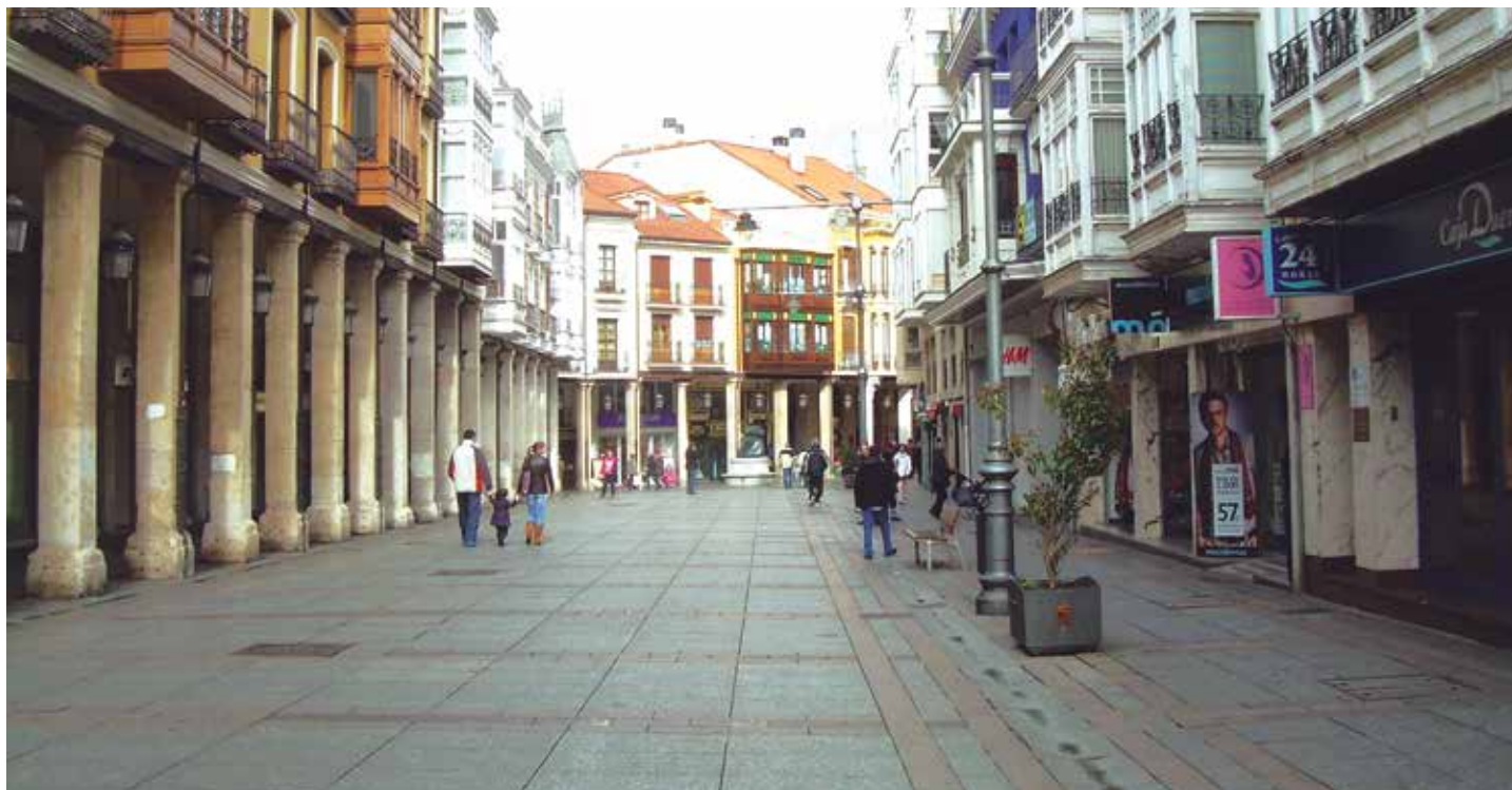
La implantación de establecimientos comerciales no estará sujeta, con carácter general, a régimen de autorización.

El Real Decreto Ley disminuye, por tanto, los umbrales establecidos en la norma de 2012 para extender el régimen especial de libertad de horarios a un mayor número de zonas en municipios de singular atractivo turístico. A estas ciudades se han sumado con posterioridad declaraciones voluntarias de otros municipios, entre los que destacan como capitales de provincia Ávila, Valladolid, Salamanca, Badajoz y Cáceres, además del municipio de Mérida y la ciudad autónoma de Ceuta.