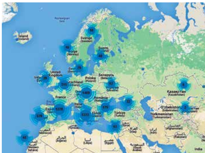
Número de signatarios del Pacto por países.

Nota de la redacción: Carta Local informará sobre el contenido y los detalles del programa de CONAMA 2014 en el próximo número de septiembre de la revista.