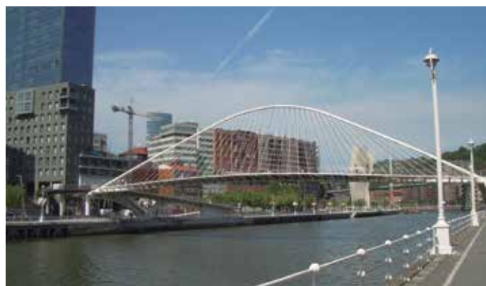
La presentación del proyecto tuvo lugar en la ciudad de Bilbao.

Las quince ciudades comprometidas con el "Camino Cultural Atlántico" trabajarán conjuntamente en proyectos compartidos que contribuyan a la