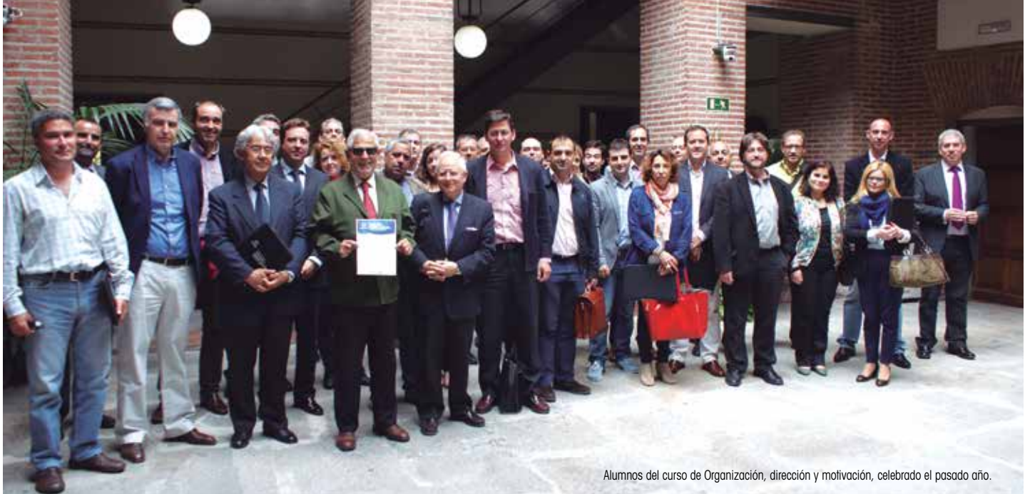
Alumnos del curso de Organización, dirección y motivación, celebrado el pasado año.