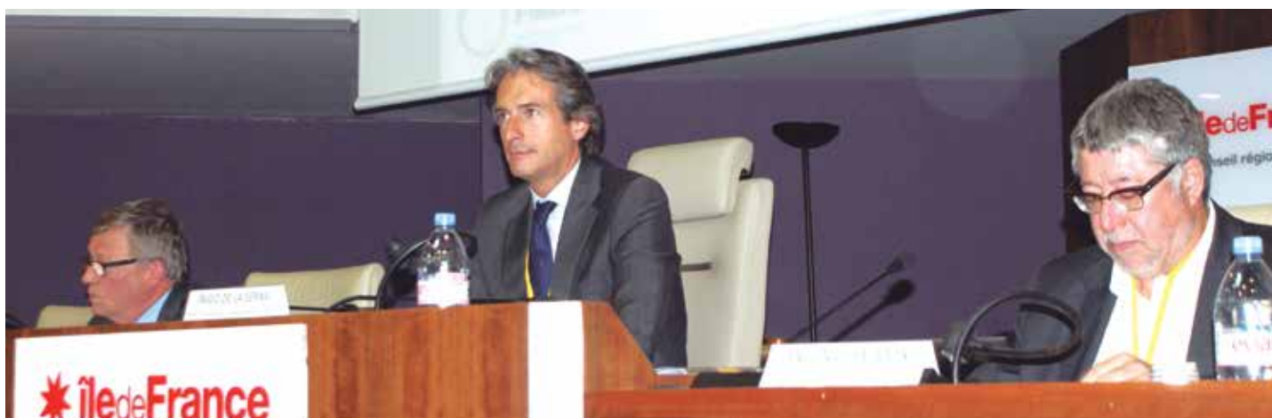
El Presidente de la FEMP durante su intervención en la apertura de la Conferencia celebrada en París.

El Presidente de la FEMP y Alcalde de Santander, Íñigo de la Serna, reivindicó el protagonismo de las ciudades como motores de cambio, de progreso y de innovación, durante su intervención en la conferencia europea que tuvo lugar recientemente en París y en la que intervino en calidad de Vicepresidente del Consejo de Municipios y Regiones de Europa (CMRE).