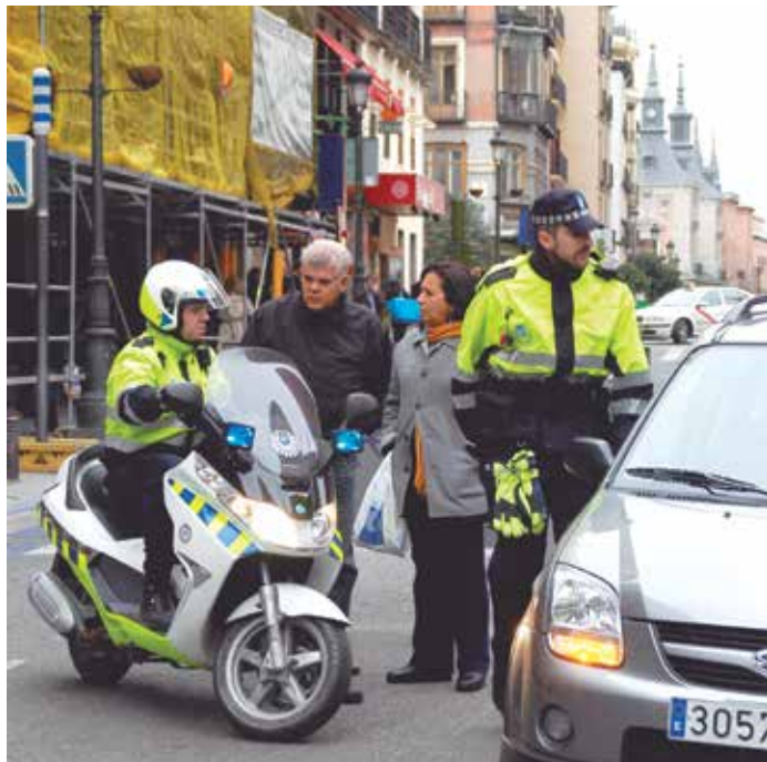
La norma recoge el reconocimiento de las competencias locales en su desarrollo y aplicación.

El Capítulo III regula las actuaciones para el mantenimiento y restablecimiento de la seguridad ciudadana. Aquí, la Ley crea un marco jurídico adecuado para el trabajo de las Fuerzas y Cuerpos de Seguridad, al tiempo que regula con mayor detalle y, por tanto, con mayores garantías para los ciudadanos, las potestades de intervención policial (identificaciones, cacheos, controles en vías públicas, etcétera).