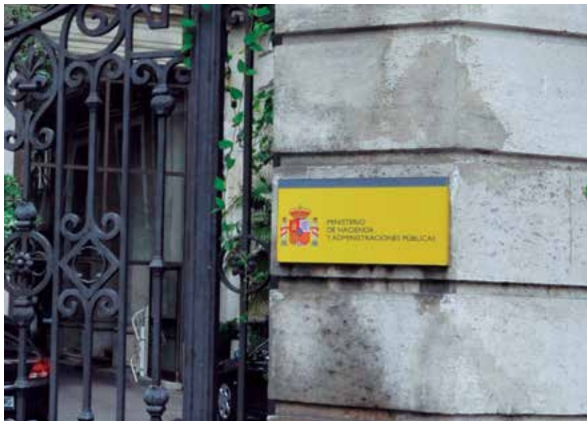
Para suscribir nuevas operaciones de crédito, es preciso contar con la autorización del MINHAP.

El tercero de los requisitos señala que la operación de endeudamiento no podrá incorporar la garantía de la participación en los tributos del