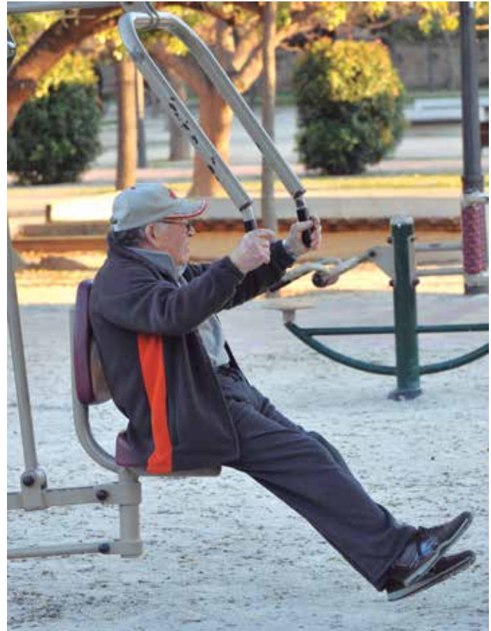
La FEMP colaborará en la puesta en marcha del proyecto NUPHYCO, centrado en conocer la situación funcional, mental, hábitos y calidad de vida y, autopercepción de salud de la población de edad más avanzada.

El programa PENTAURO, para la regulación de la tauromaquia como patrimonio cultural, se articula en torno a cinco ejes estratégicos y nume-