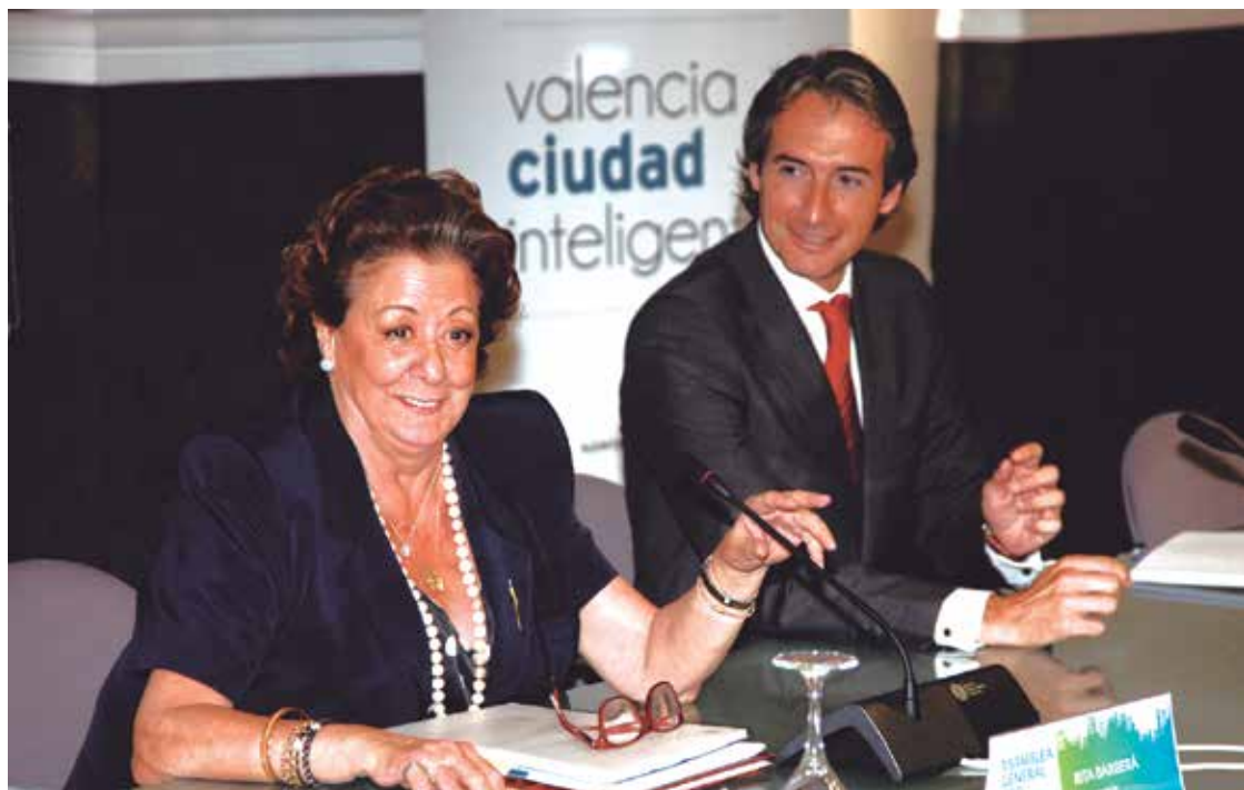
Rita Barberá e Iñigo De la Serna, en la reunión de Valencia.

La Red Española de Ciudades Inteligentes fue constituida en junio de 2012 con el objetivo de intercambiar experiencias y trabajar conjuntamente para desarrollar un modelo de gestión sostenible y mejorar la calidad de vida de los ciudadanos, incidiendo en aspectos como el ahorro energético, la movilidad sostenible, la eAdministración, la atención a las personas o la seguridad. Actualmente está formada por 54 ciudades.★