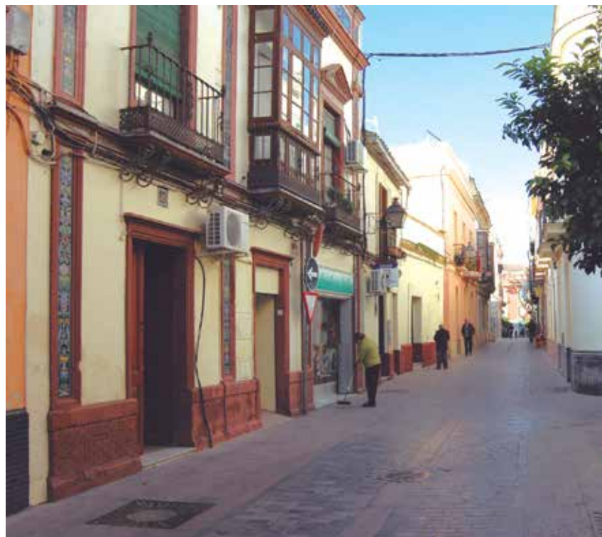
Jerez entra en la nueva clasificación.

La implantación de establecimientos comerciales no estará sujeta, con carácter general, a régimen de autorización. No obstante, se podrá someter a una única autorización, que se concederá por tiempo indefinido, cuando concurren razones imperiosas de interés general: se contempla, exclusivamente, el caso de que las instalaciones o infraestructuras físicas