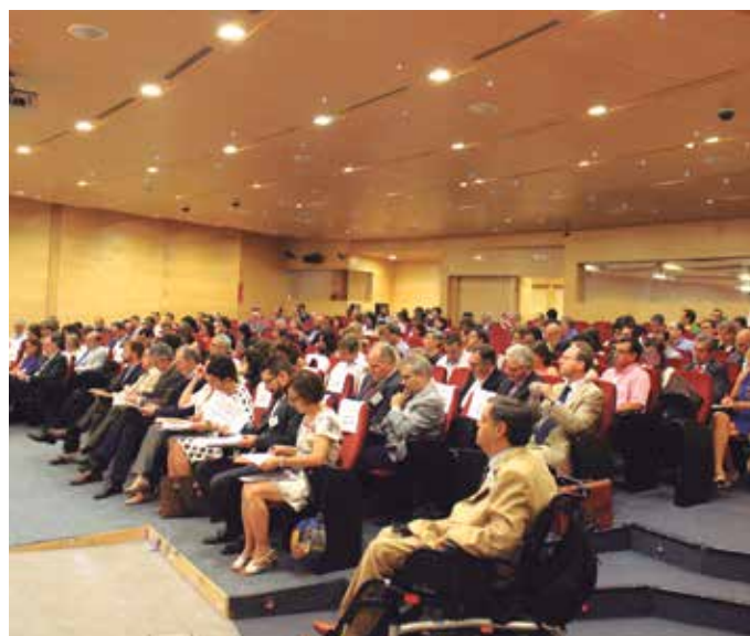
A la izquierda, los dos Directores Generales que presiden la Red, durante la apertura del Pleno. A la derecha, los asistentes al acto.