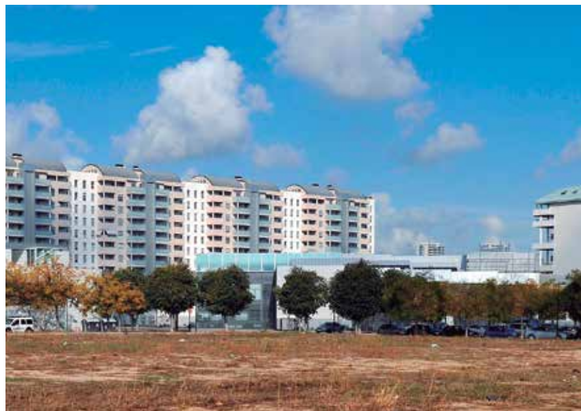
La medida, de gran contenido social, había sido propuesta en la CNAL de junio.

Y se completa señalando la supresión del apartado 3 del artículo 106, en el que se decía que "con ocasión de la dación en pago de su vivienda (...) tendrá la consideración de sujeto pasivo sustituto del contribuyente la entidad que adquiera el inmueble, sin que el sustituto pueda exigir del contribuyente el importe de las obligaciones tributarias satisfechas" . ★