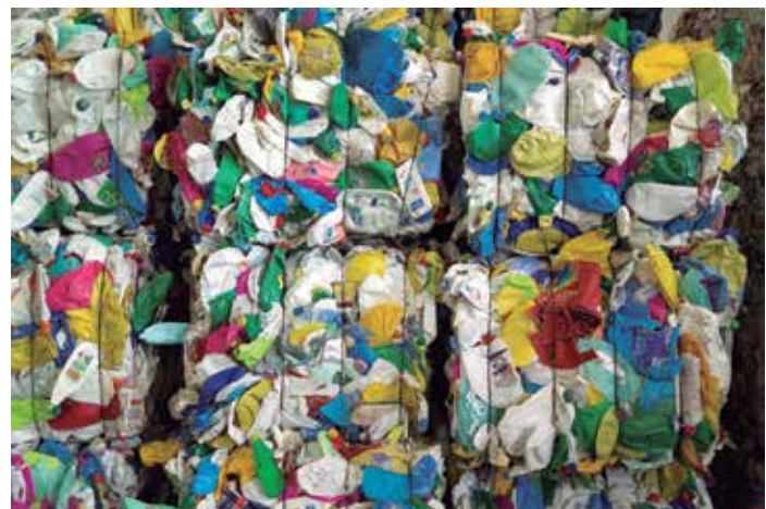
Los casi 1,2 millones de toneladas de envases reciclados sitúan a nuestro país en puestos de cabeza en la UE.

Ese reciclado ha traído consigo la reducción de 13,8 millones de toneladas de CO 2 emitidas a la atmósfera, una cantidad similar a la que