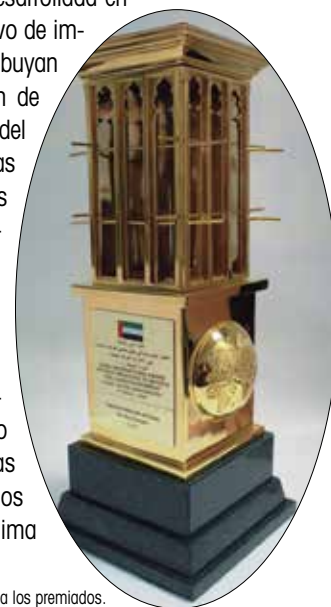
Trofeo que se entrega a los premiados.

Esta es la décima edición del Premio Internacional de Dubái, al que pueden acudir instituciones públicas y privadas, académicas, no gubernamentales, de comunicación y personas físicas. En la edición de 2008 obtuvo uno de los premios la Red Española de Ciudades por el Clima de la FEMP.