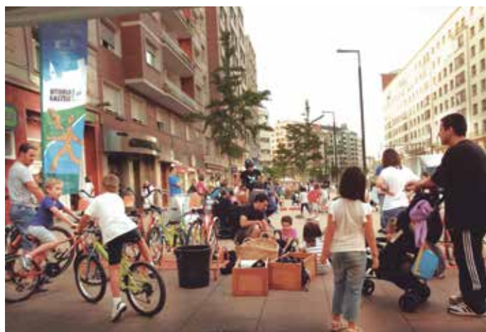
Actos de la Semana Europea de la Movilidad en Vitoria-Gasteiz.

La ciudad ganadora es elegida por un panel independiente de expertos. La edición de 2013 del concurso fue para Ljubljana, la capital de Eslovenia.