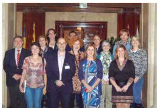
Premiados en la edición de 2013

La Agencia Española de Consumo, Seguridad Alimentaria y Nutrición (AECOSAN) ha convocado la edición 2014 de los Premios Estrategia NAOS, unos galardones con los que se pretende impulsar iniciativas para la prevención de la obesidad y otras enfermedades crónicas derivadas, a través de una alimentación saludable y la práctica regular de actividad física.